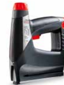
2007 Novus J-214 Akkutacker | cordless tacker