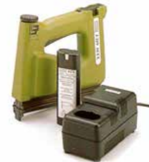
1990 Novus J-219 Akkutacker | cordless tacker

We are committed to helping people effortlessly achieve their goals – whether in their professional projects or their hobbies – by designing and producing high-end tackers that combine innovative German engineering with highest standards of quality.