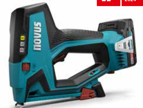
2023 Novus J-551 Akkutacker | cordless tacker

Die Akkutacker der neuesten Generation überzeugen mit noch mehr Geschwindigkeit, Ergonomie, Komfort und Präzision.