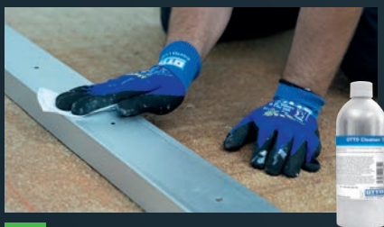
3 Profilunterseite reinigen