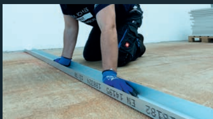
5 Profil ausrichten und andrücken