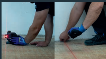
2 Montagestelle festlegen & markieren