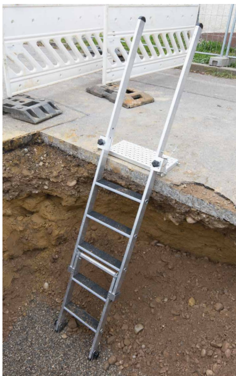
Abb. Bestell-Nr. 12040 mit 12042