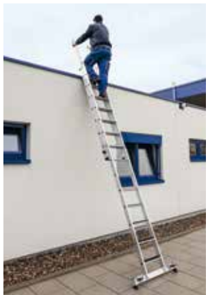
Stufen-Schiebeleiter 2-teilig mit nivello®-Traverse