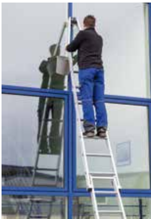
Stufen-Glasreinigerleiter mit nivello®-Traverse

– 50 % der Anschaffungs- kosten bis Maximalbetrag